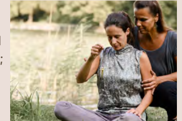
Energetisch für sich und andere arbeiten

Sie erlernen 1) Hypnotische Methoden, um die eigene Energie gezielt einzusetzen und damit Emotionen, ungesunde Wiederholungen und körperliche Symptome verändern; 2) Techniken der HypnoEnergetik für den Alltag, für Anfänger und Fortgeschrittene geeignet; 3) Techniken zur Ausprägung der eigenen Intuition, um hier den Durchbruch auch in der «Glaubwürdigkeit» der eigenen Gefühle zu schaffen; 4) die erstaunlichen Wirkungen von intuitiven Entscheidungen, Symbolen, Naturverbundenheit und der Kraft der Regeneration.