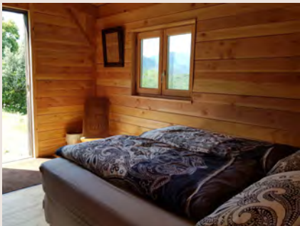
Unterbringung im Einzelzimmer oder im eigenen Chalet auf dem Grundstück