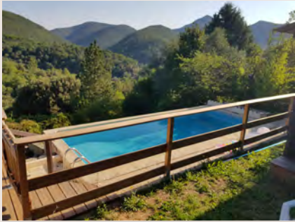
10 Tage auf verwöhnendem Anwesen in St. Hippo am Fuße der Cevennen